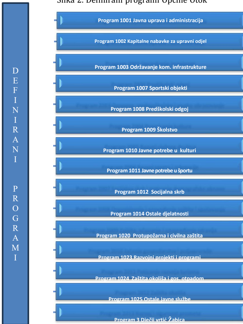
Slika 2. Definirani programi Općine Otok

Detaljno objašnjenje i opis programa možete pronaći u obrazloženju Proračuna.